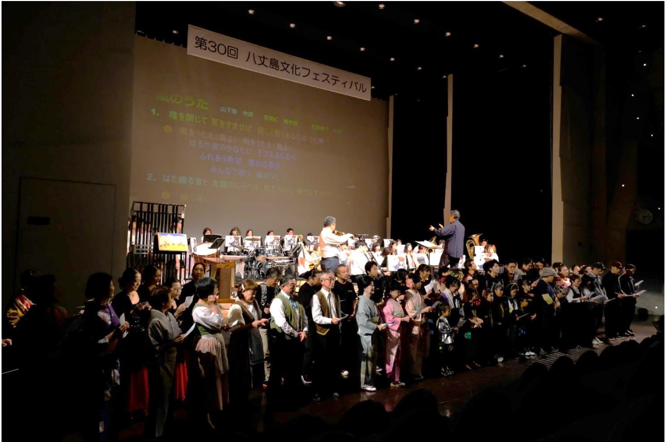
第30回八丈島文化フェスティバル フィナーレ