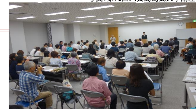
写真: 第73回八丈島民大学講座

主催: 八丈島文化協会 / 後援: 八丈町教育委員会 問い合わせ: 八丈島民大学講座運営委員会 事務局 電話 090-8036-1826